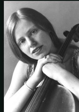
Over Jacqueline du Pré